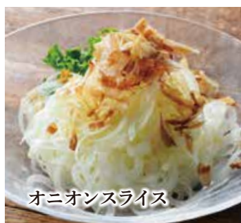
オニオンスライス